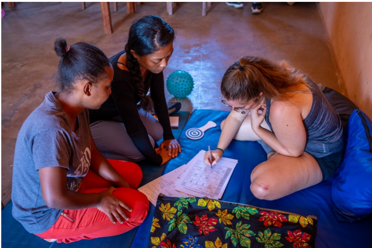
Action organisée du lundi 23 mars au samedi 28 mars 2026, District Tsiroanomandidy, Région Bongolava, Madagascar